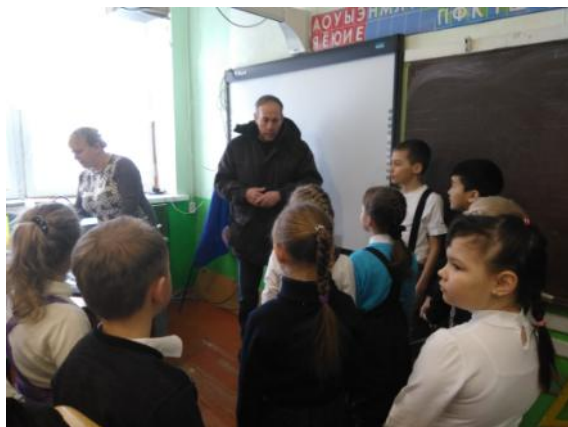
Напутствие перед игрой